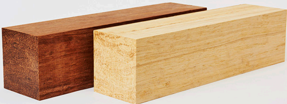
高密度圧縮ブロック

熊本（南関町）から創造的復興に向けて 竹資源に特化した新技術開発による 先進的ビジネスモデルを提案する。