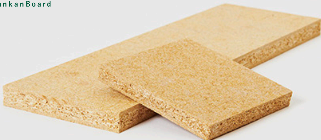
機能性バンブーボード